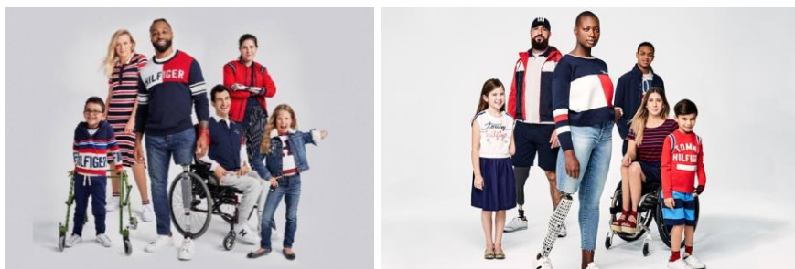
Рисунок 1 - Коллекция «Tommy Hilfiger Adaptive»

Третий, современный этап отражает институционализацию инклюзивности в глобальной «fashion»-индустрии, когда адаптивные коллекции становятся частью стратегий крупных брендов, таких как «Tommy Hilfiger» и «Nike» [8, 9] (Рисунок 1, 2). Это свидетельствует о переходе инклюзивного дизайна из нишевого сегмента в систему устойчивого и экономически обоснованного проектирования.