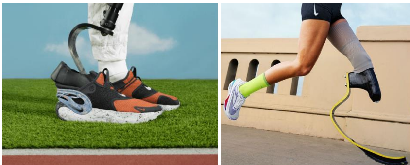
Рисунок 2 - из коллекции «Nike Adaptive»

https://static.nike.com/a/images/f_auto%2Ccs_srgb/w_1920%2C_limit/92c83c6-07ad-48df-8295-1daa61472e50/nike-flyease.png