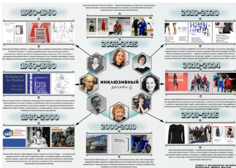
Рисунок 3 - Графическое представление «ИНКЛЮЗИВНЫЙ ДИЗАЙН»

Существенную роль сыграла деятельность «Helen Hamlyn Centre for Design» при «Royal College of Art», где были разработаны научные методы «user-centered design» и антропометрические исследования, ориентированные на разнообразие телесных параметров [6]. Современные бренды и дизайнеры продемонстрировали, что инклюзивная одежда может быть частью «mainstream»-культуры и коммерчески успешным продуктом.