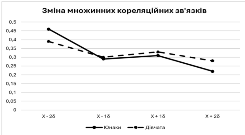
Рис. 1. Зв'язок компонентів темпераменту з загальною інтелектуальною активністю по групах студентів.

За результатами проведеного аналізу видно чітку тенденцію до зменшення залежності загальної інтелектуальної активності від темпераменту особистості в процесі інтенсифікації інтелектуальних проявів. Для більш детального розгляду цього явища кореляційний аналіз зв'язків темпераменту було проведено по компонентах інтелектуальної активності: ергічності (витривалості), пластичності та швидкості інтелектуальних процесів (рис.2, 3).